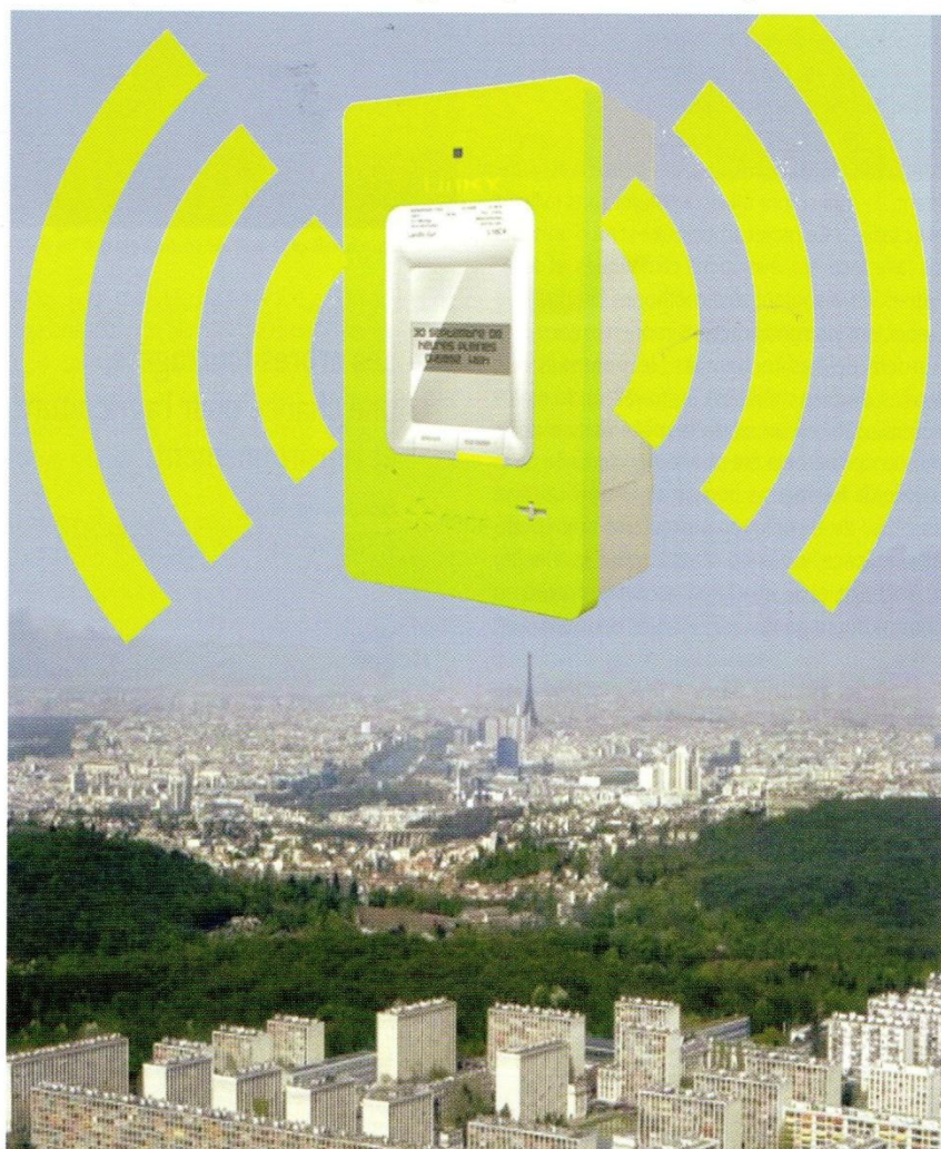
▼ Parmi d'autres, l'association Meudon sans Linky appelle à refuser l'installation des compteurs communicants.

Simultanément, des centaines de Conseils municipaux se prononcent contre l'installation de ces compteurs sur leur territoire, allant de toutes petites communes à des villes de plus de 100 000 habitants comme Caen ou Aix. (3)