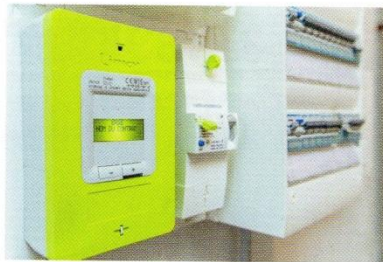
▲ Les anciens compteurs étaient prévus pour durer 60 ans; au mieux, le Linky est prévu pour 20 ans