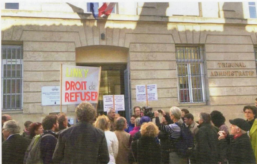
▲ Procédure en référé au Tribunal Administratif de Bordeaux