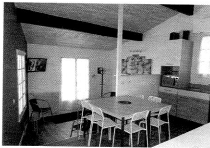
▲ Dans certaines maisons équipées de Linky, les appareils électriques se déclenchent de façon intempestive